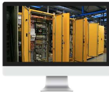
VÝROBA A MONTÁŽ